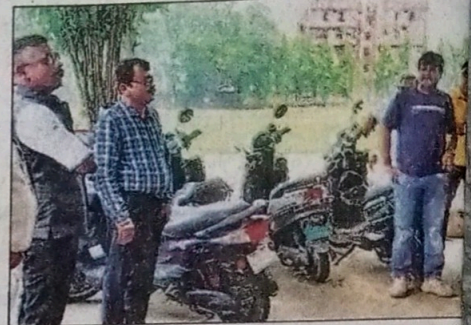
स्कूली बच्चों से वाहन जब्त करने के बाद अभिभावकों को