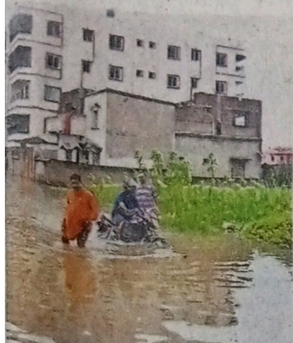
इटी का इलाका सोमवार रात हुई बारिश के को आवागमन में दिक्कत हो रही है