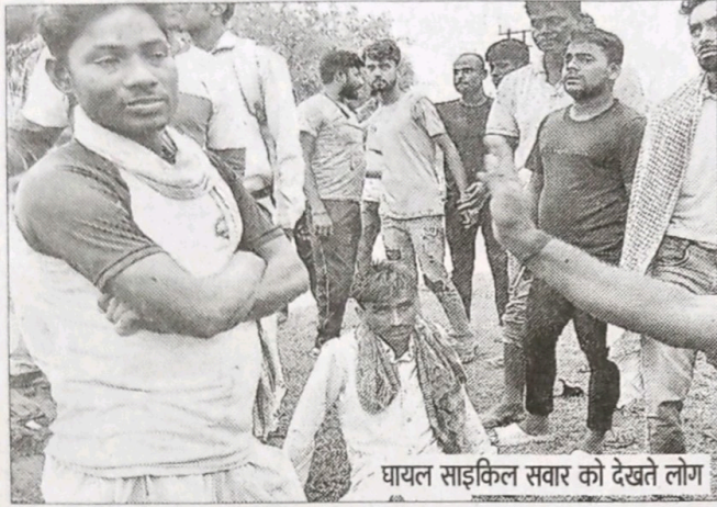
घायल साइकिल सवार को देखते लोग

दौरान पीछे चल रही कार संख्या जेएच 10 सीएच 4122 ब्रेक लगाया तो पीछे से तेज रफतार से आ रहे किसी वाहन ने अनियंत्रित होकर टक्कर मार दी और फरार हो गया। अज्ञात वाहन के धक्के से असंतुलित कार ने