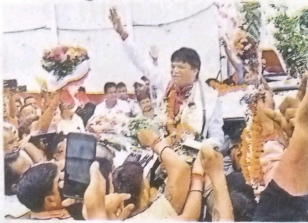
धनबाद रेलवे स्टेशन पर सांसद दुलू महतो का स्वागत करते कार्यकर्ता

मौके पर सांसद ने कहा कि मैं जो भी हूँ, वह धनबाद की जनता के वजह से ही हूँ। उन्होंने कहा कि जनता की सेवा करने का जो अवसर मुझे मिला है, मैं उसे पूरी निष्ठा से निभाऊंगा। प्रधानमंत्री नरेंद्र मोदी के नेतृत्व में विकसित और आत्मनिर्भर भारत के सपने को साकार करने के लिए हम सब मिलकर दिन-रात काम करेंगे। उन्होंने कहा कि वर्षों से धनबाद में एयरपोर्ट और फ्लाईओवर की मांग जल्द ही पूरी होगी। सांसद दुलू किया फुलारीटाड़ में तालाब का उद्घाटन, नावागढ़ : सांसद दुलू महतो ने गुरुवार को शाम को